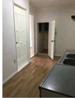
거실 및 부엌